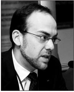
Рубен-Ерік ДІАС-ПЛАХА, експерт з демократичного врядування Відділу демократичного управління та громадської участі у публічних справах Департаменту демократизації Бюро ОБСЄ з демократичних інститутів і прав людини